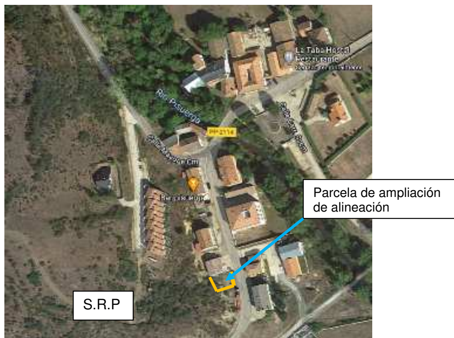
Imagen aérea del término municipal de San salvador de Cantamuda