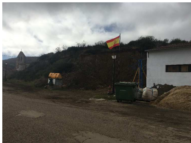
Imágenes de la zona de la parcela de ampliación de la alineación en C/Carretera, 7, parcela contigua con la municipal de C/Carretera, 9, en la que se encuentra el almacén municipal, empleando actualmente la zona de ampliación para el acopio de materiales municipales.