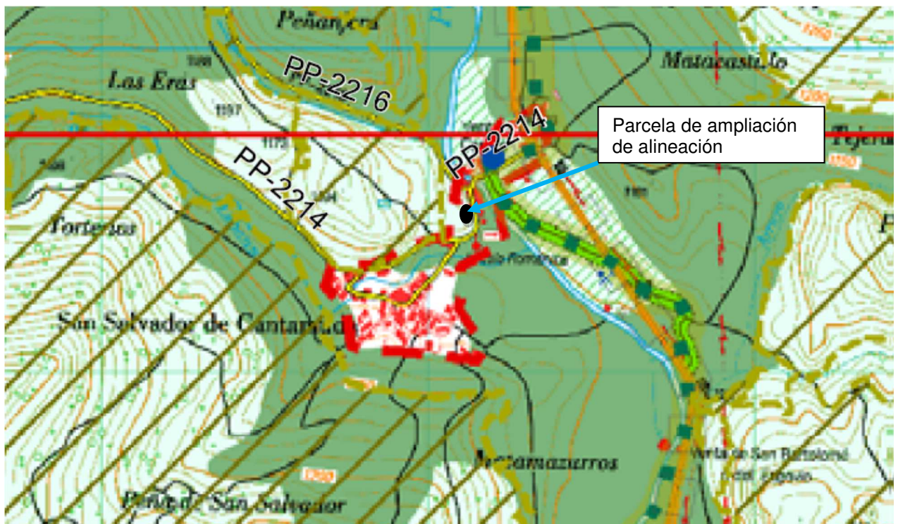
Reproducción parcial plano Directrices de ordenación Territorial de la Montaña Cantábrica Central Hoja 21 Se indica en color verde la zona de Red de Espacios Naturales y Red Natura 2000