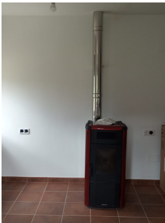
Calefacción de pelets