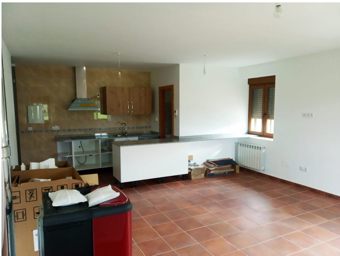
Cocina - Salón