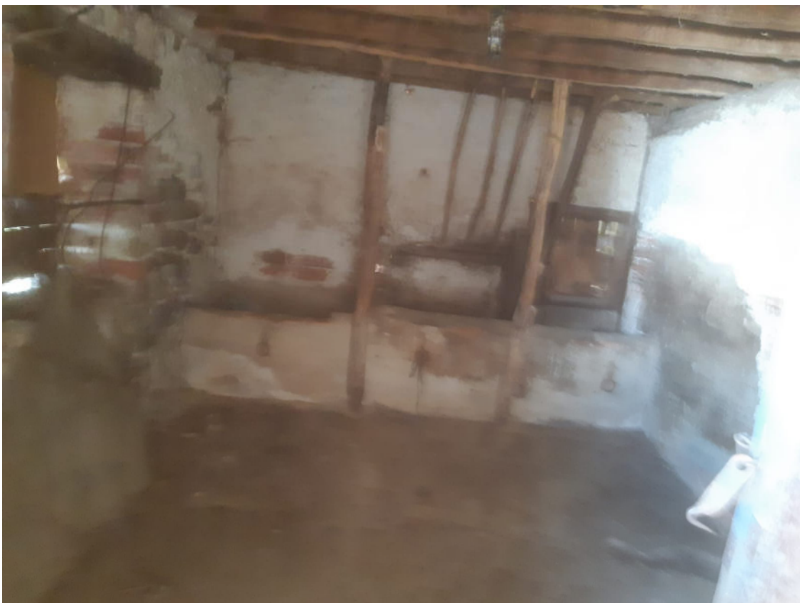
Anexo 2 4,30x3