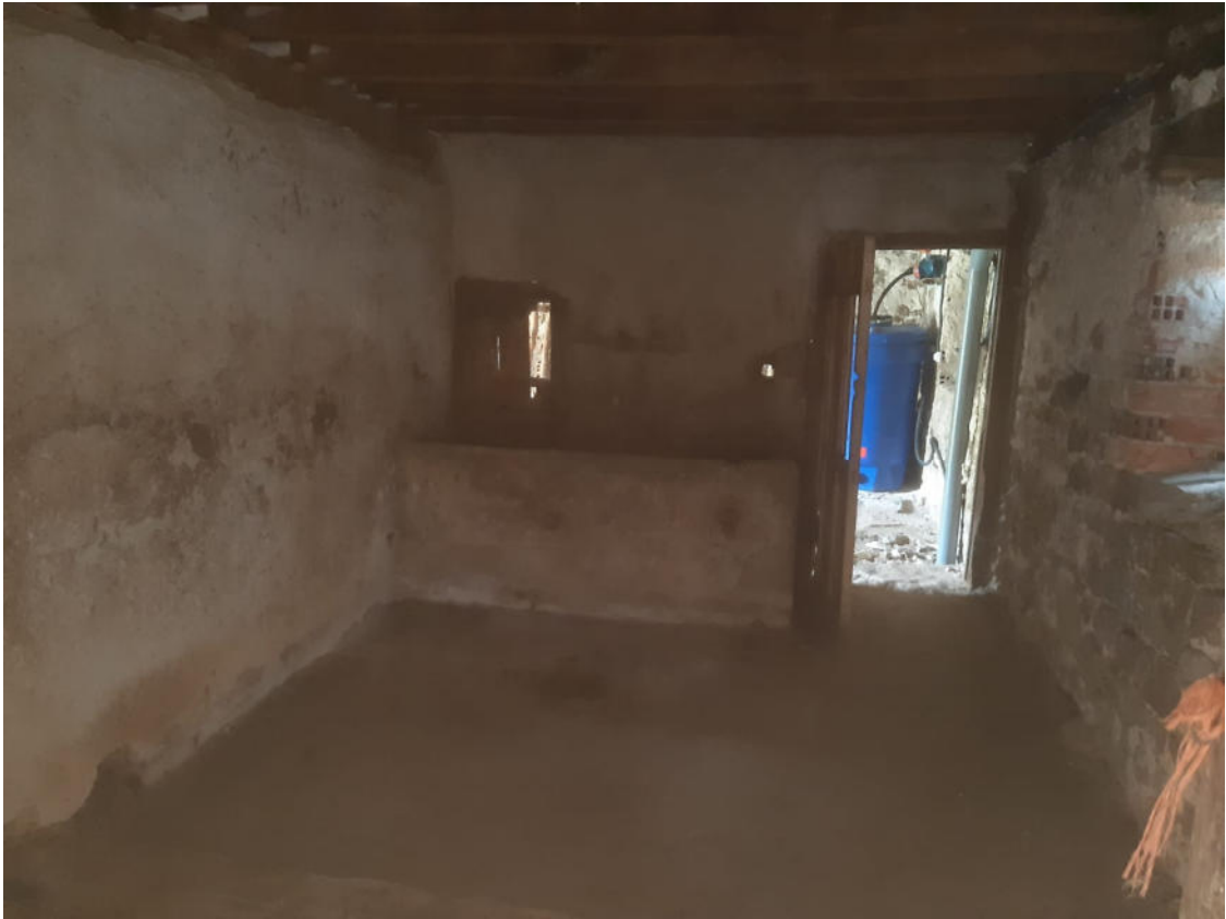
Anexo 3 -4,30x 3