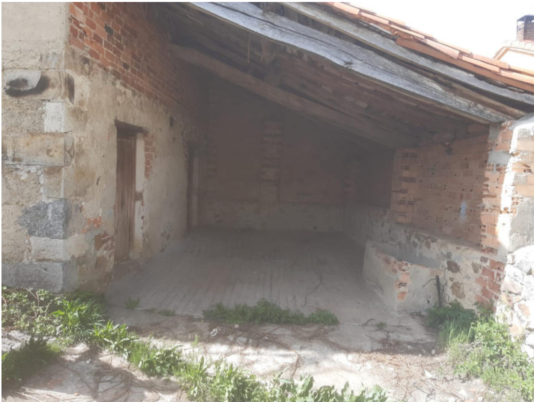
Anexo 1 7,50x4,20