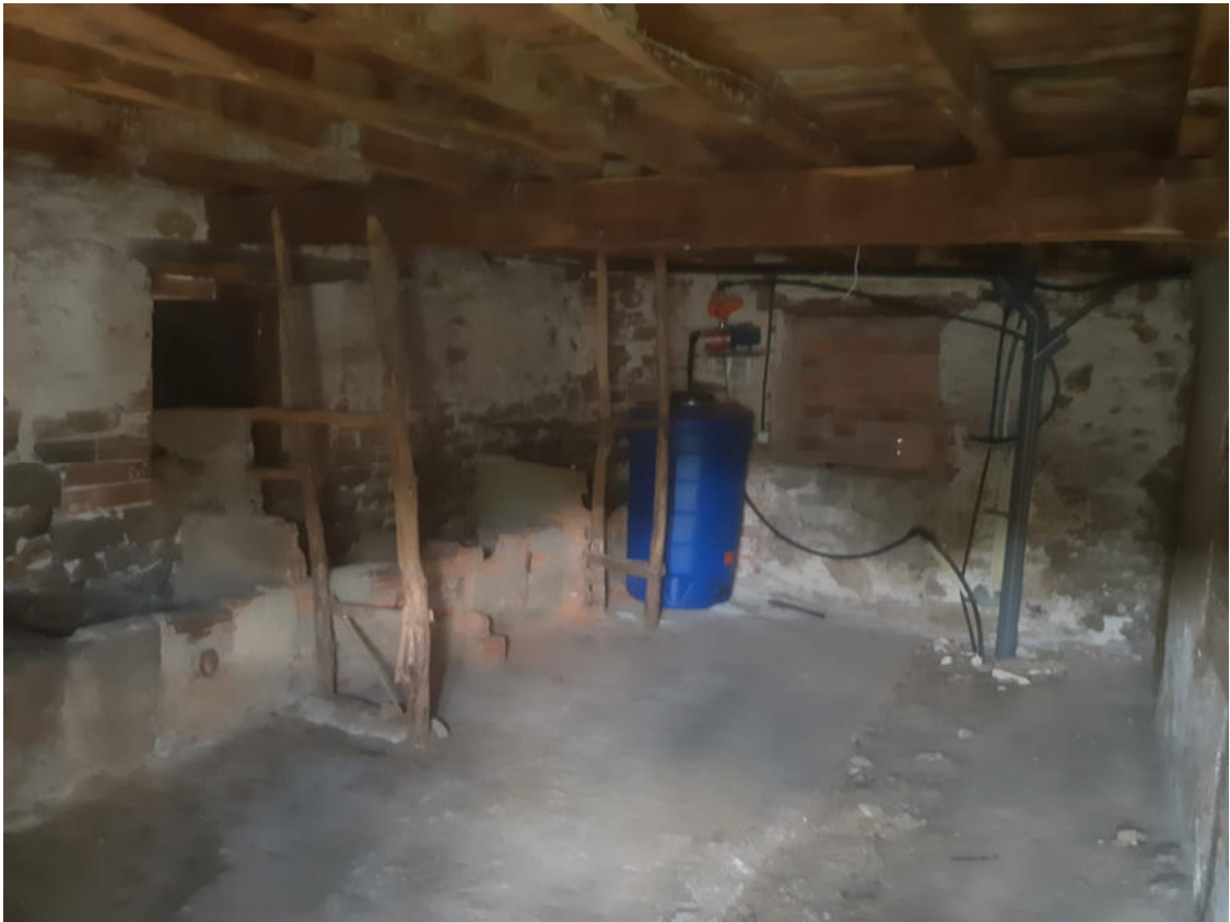
Anexo 4 -6,30x4,10